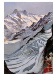
Umschlag: Station Eismeer der Jungfrau-Bahn mit Schreckhörnern. Der Plakatmaler Anton Reckziegel setzt sich selbst als Tourist ins Bild. Original in der Ausstellung. Anton Reckziegel (1865–1936), Entwurf Schreckhörner (Ausschnitt), nicht publiziert, 1905, Gouache, 94,5 × 66,5 cm, Alpines Museum der Schweiz

19.00 Nachtessen im ABZ für angemeldete Gäste