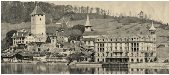
Der Schlossbesitzer Ferdinand Rudolf Albrecht von Erlach investierte in den Tourismus: er liess den See aufschütten und durch den Architekten Horace Edouard Davinet das Hotel Spiezerhof bauen. Foto: Hotel Spiezerhof im Bau, 1873